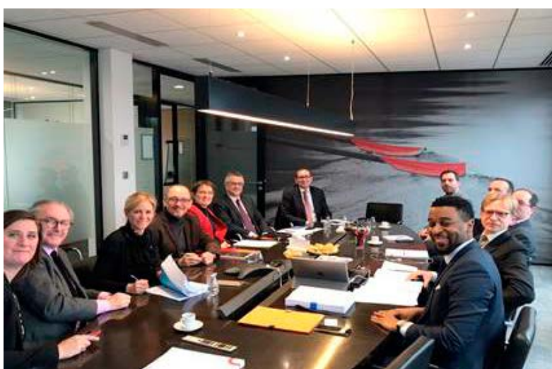
« Signature avec les directions de HAROPA Ports de Paris, de Ikea France et de Vaillog »

Développé par VAILLOG, la future plateforme nouvelle génération à double étage « Paris Air 2 Logistics » située au cœur du port de Gennevilliers accueillera sur 50 000m 2 Ikea France afin d'approvisionner Paris et l'Ouest de l'Île de France à la fin de l'année 2018.