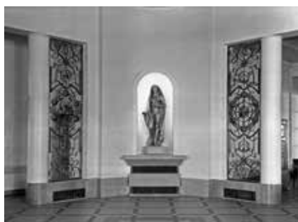
Le petit salon.