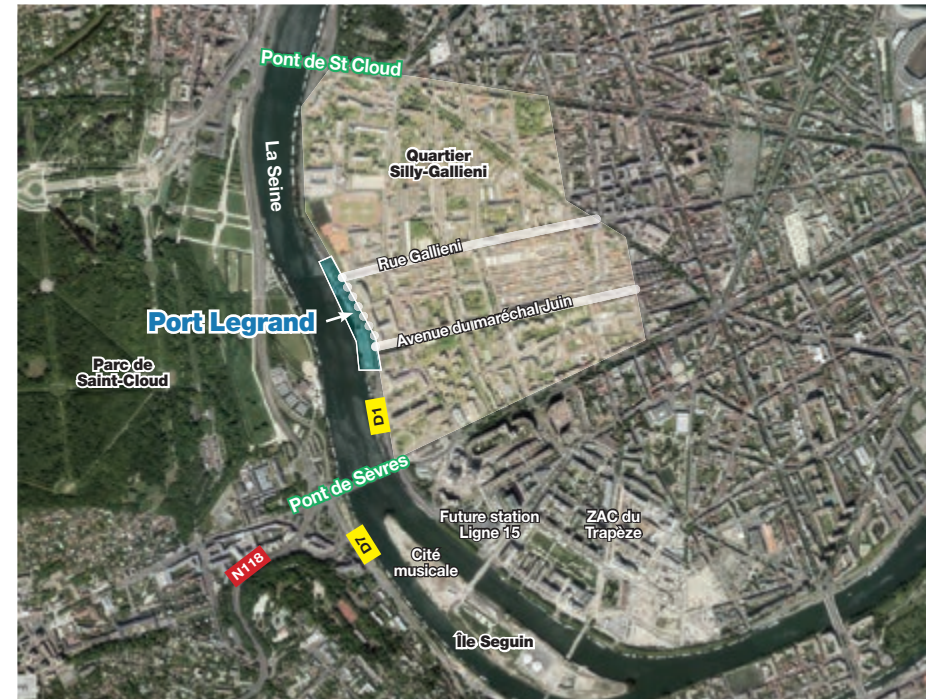
Situé au carrefour du quai Le Gallo (RD1) avec l'avenue du maréchal Juin et la rue Gallieni, le port Legrand dispose d'une bonne desserte et d'un cadre paysager attractif.

Les aménagements extérieurs du port étant vieillissants, HAROPA - Ports de Paris souhaite mettre à profit cette période de transition pour lancer une importante opération de réaménagement de l'ensemble du port, en cohérence avec l'ambition qu'il porte de desservir la Région Capitale par la voie d'eau et d'aménager des ports ouverts sur la Ville.