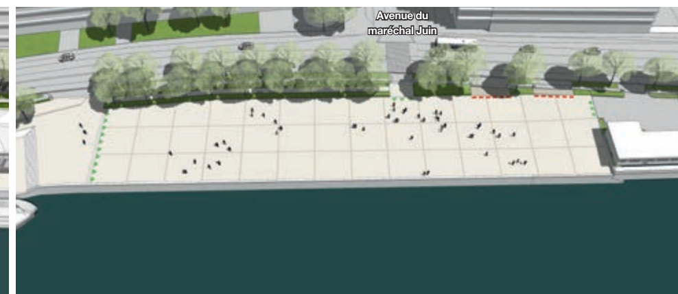
Le quai à usage partagé* en dehors des horaires d'utilisation par les entreprises

*Les quais à usage partagé sont des espaces mis à la disposition de toutes les entreprises qui souhaitent recourir au fleuve pour le transport ponctuel de marchandises et de matériels, participant ainsi à la diminution du nombre de camions sur les routes.