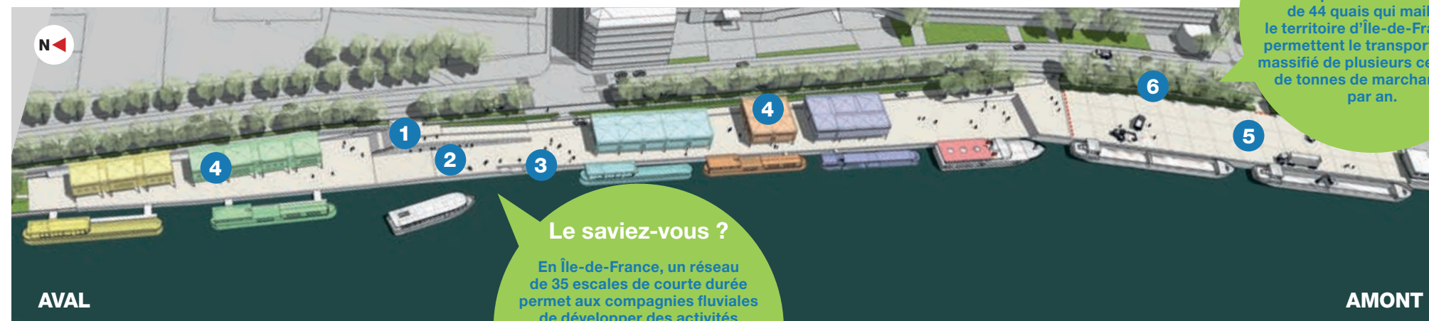
Vue d'ensemble du port réaménagé, du quai à usage partagé* en période d'utilisation par les entreprises