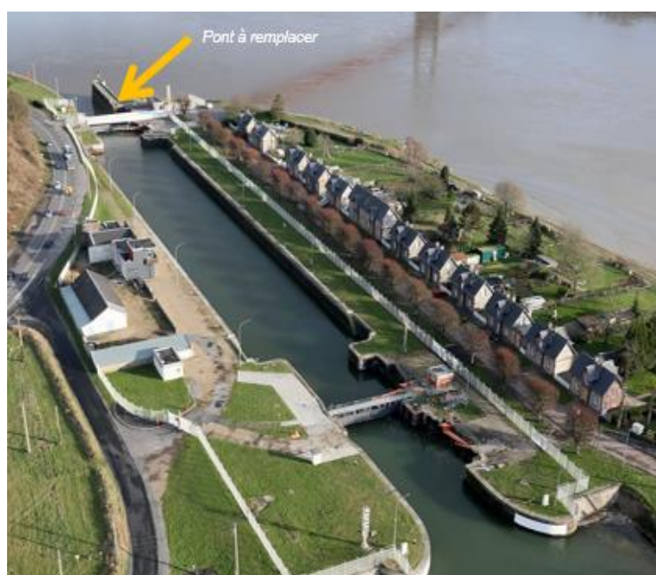
Pont de l'ancienne écluse de Tancarville

A compter du 30 septembre 2019 et jusqu'à janvier 2020, dans le cadre des travaux de modernisation et fiabilisation des écluses de Tancarville, HAROPA – Port du Havre démarre les travaux de remplacement du pont piéton / routier de l'ancienne écluse.