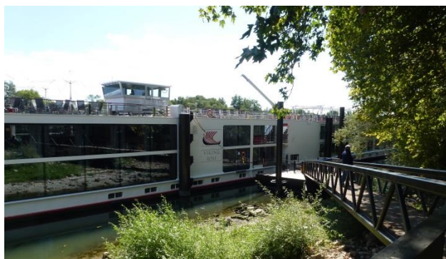
Ponton d'accès au bateau