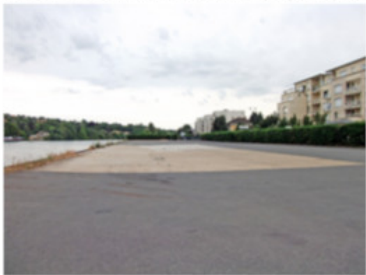
Zone de stationnement des commerçants du marché Maison-éclusière hébergeant une activité de bateau-école