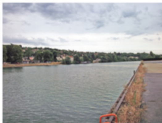
Vue vers Saint-Pierre-du-Perray, depuis le port