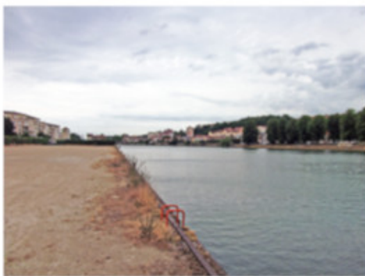
Vue vers l'autre rive de Corbeil-Essonnes, depuis le port

Le port de Corbeil Saint-Nicolas s'inscrit dans un environnement naturel avec notamment une vue sur le parc du Château et le quai des Platanes de Saint-Pierre-du-Perray. À l'extrémité sud du port se trouve par ailleurs l'ancienne baignade de Corbeil-Essonnes.