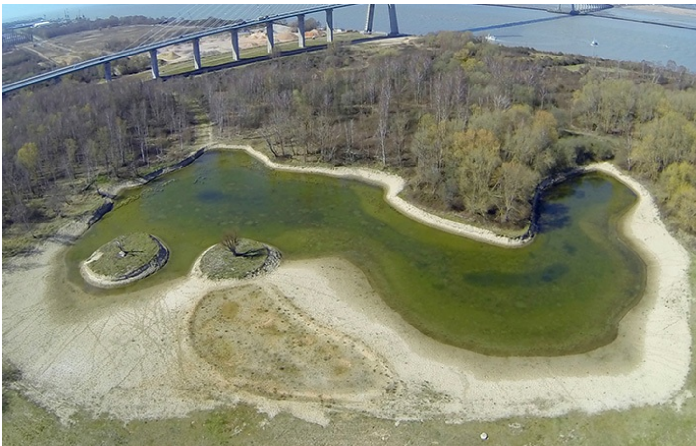
Création de zones humides à Honfleur